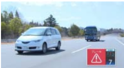
万が一の速度軽減システム