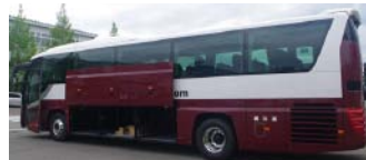
荷物トランクは3列ございます