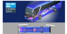
横転やスピン、横滑りを制御する 車両の安定性機能