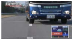
ハンドル操作のふらつき注意 車線からの逸脱注意