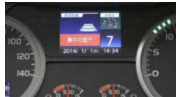
ドライバーの目の開閉状態を コンピューター監視