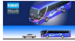
車間距離自動保持